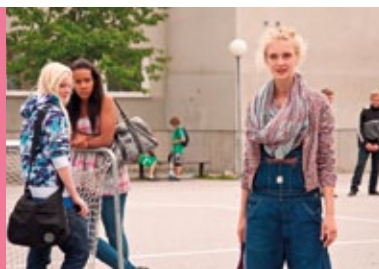
Tysiąc razy silniejsza reż. P. Schildt Szwecja 2010, 85'

Każde zagadnienie omawiane w trakcie prelekcji multimedialnej może być dodatkowo pogłębione na zajęciach szkolnych. Służą do tego opracowane specjalnie na potrzeby projektu materiały dydaktyczne.