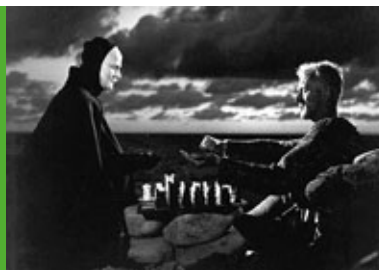
Siódma pieczęć reż. I. Bergman Szwecja 1956, 96'

Każde zagadnienie omawiane w trakcie prelekcji multimedialnej może być dodatkowo pogłębione na zajęciach szkolnych. Służą do tego opracowane specjalnie na potrzeby projektu materiały dydaktyczne.