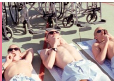
4. piętro reż. A. Mercero Hiszpania 2003, 101'

Każde zagadnienie omawiane w trakcie prelekcji multimedialnej może być dodatkowo pogłębione na zajęciach szkolnych. Służą do tego opracowane specjalnie na potrzeby projektu materiały dydaktyczne.