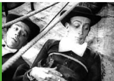
Pies andaluzyjski reż. L. Buñuel Francja 1929, 13'

Każde zagadnienie omawiane w trakcie prelekcji multimedialnej może być dodatkowo pogłębione na zajęciach szkolnych. Służą do tego opracowane specjalnie na potrzeby projektu materiały dydaktyczne.