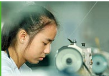
China blue reż. M. X. Peled USA 2005, 86'

Każde zagadnienie omawiane w trakcie prelekcji multimedialnej może być dodatkowo pogłębione na zajęciach szkolnych. Służą do tego opracowane specjalnie na potrzeby projektu materiały dydaktyczne.